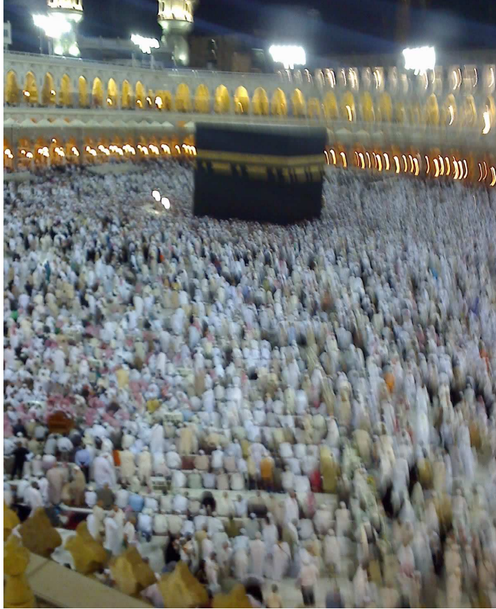
KÂ'BE-İ MUAZZAMA "MEKKE-İ MKERREME"